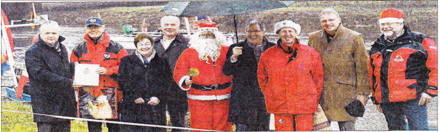
De Coevordenaren met de plaatselijke hoogwaardigheidsbekleders op de Vechtenbrücke in Emlichheim

Het IYFR-team Coevorden is nog steeds onder de indruk van de laatste ALV, waar ook de gemeenschapszin en de humor fijntjes samenwerkten. De nautische 'jongens & meisjes' van Rotary..., dat mag je rustig een apart slag noemen!